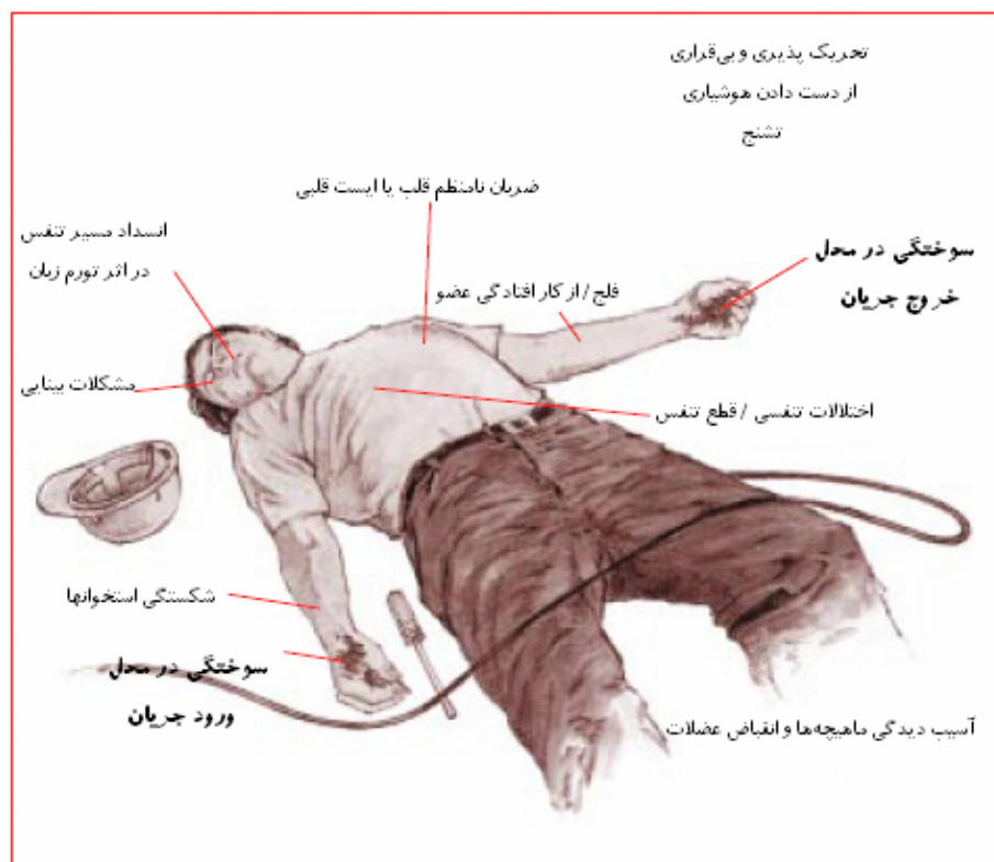
شکل ۳. آسیب‌های ناشی از برق‌گرفتگی

در شکل ۳ انواع آسیب‌های محتمل ناشی از برق‌گرفتگی نشان داده شده است.